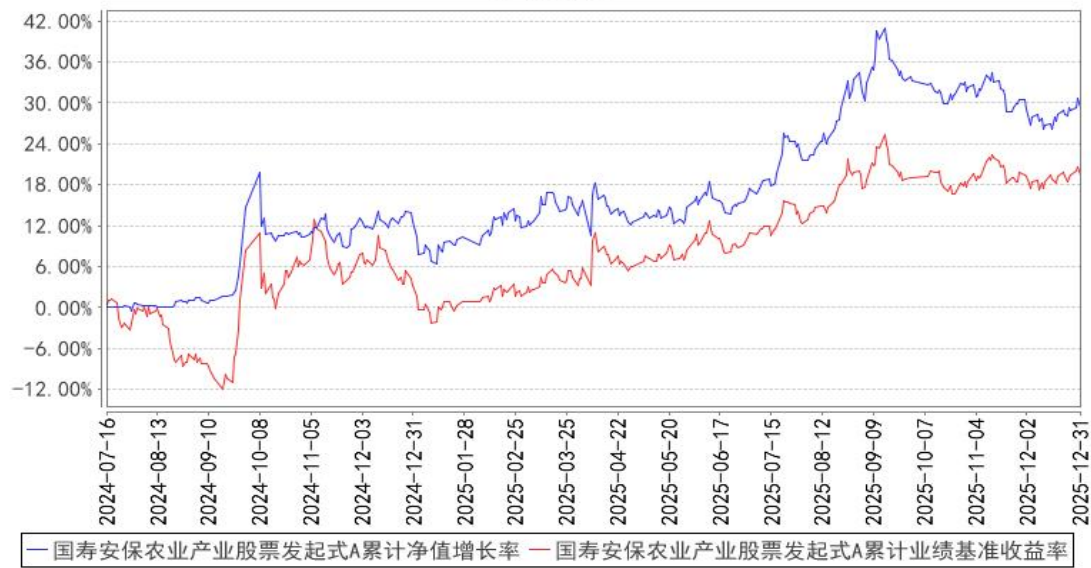
国寿安保农业产业股票发起式A累计净值增长率与同期业绩比较基准收益率的历史走 势对比图