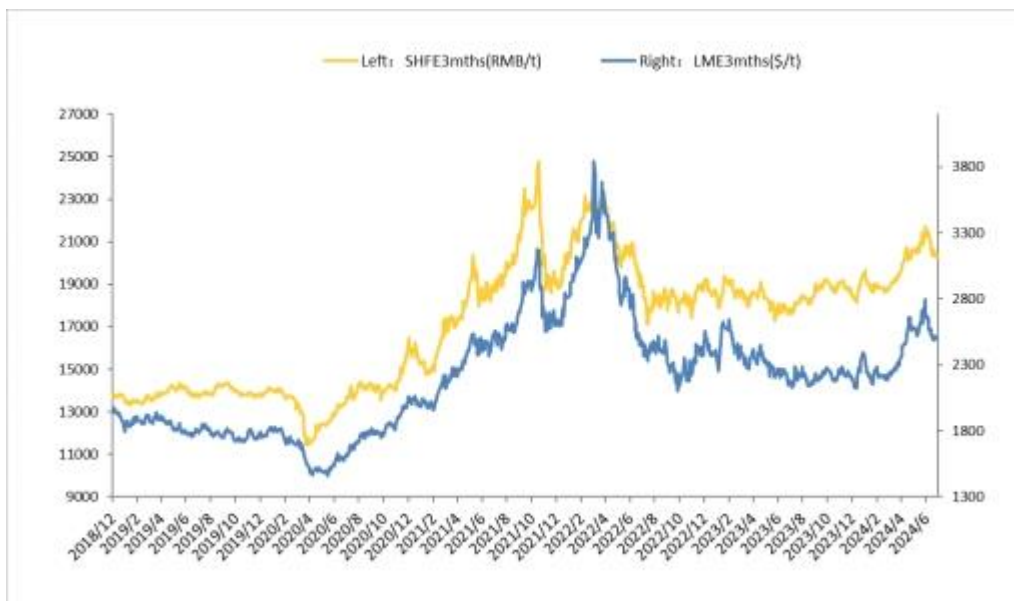
伦敦金属交易所（LME）和上海期货交易所（SHFE）铝价走势情况

2024 年上半年沪铝价格与伦铝价格基本呈现相同的走势。1-2 月份，国内经济运行平稳，各类宏观政策持续出台，协同发力，带动社会经济活力逐步恢复，但依旧面临内外部各方因素的挑战。这一时期内经历了美联储降息预期降低，春节前后下游铝加工厂停工，季节性累库等情况，铝价基本处于震荡下行阶段。3 月份开始，宏观经济进一步好转以及美联储降息预期提升，同时以铜、铝为代表的主要有色金属品种供应端受到诸多干扰，宏观和基本面均产生同向利多影响，产业和投机资金等积极入市，铝价开启快速上涨模式。上半年主力合约最高上探至 22040 元/吨，为近两年新高，6 月份随着多头资金陆续高位离场，铝价震荡回调，6 月底回落至 20300 元/吨附近。具体来看，2024 上半年，SHFE 现货和三个月期货的平均价分别为 19849 元/吨和 19846 元/吨，同比分别上涨 7.20%和 8.20%。（资料来源：安泰科）