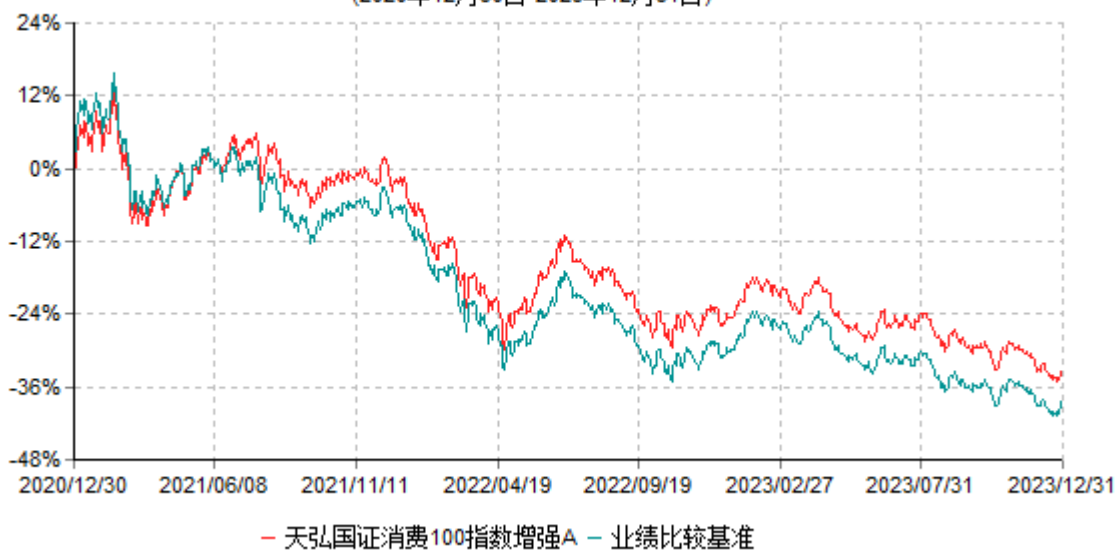
天弘国证消费100指数增强A累计净值增长率与业绩比较基准收益率历史走势对比图 (2020年12月30日-2023年12月31日)