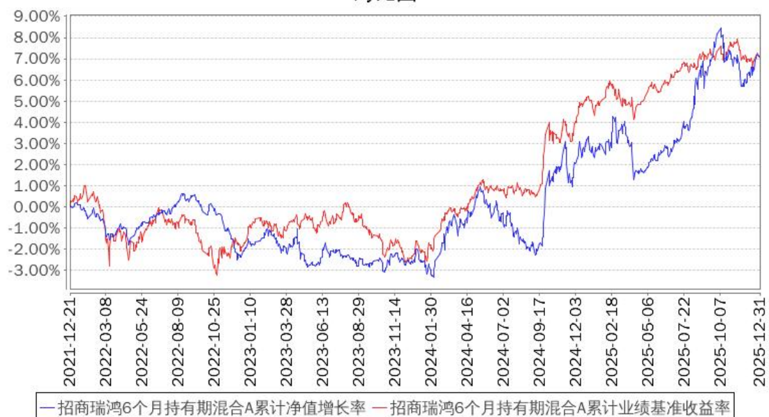
招商瑞鸿6个月持有期混合A累计净值增长率与同期业绩比较基准收益率的历史走势对比图