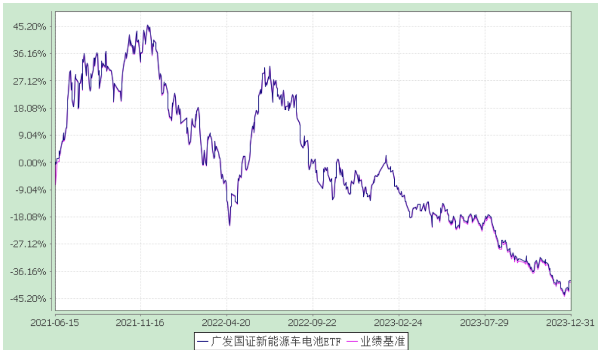
广发国证新能源车电池交易型开放式指数证券投资基金 份额累计净值增长率与业绩比较基准收益率的历史走势对比图 (2021 年 6 月 15 日至 2023 年 12 月 31 日)