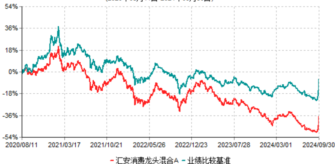
汇安消费龙头混合A累计净值增长率与业绩比较基准收益率历史走势对比图 (2020年08月11日-2024年09月30日)