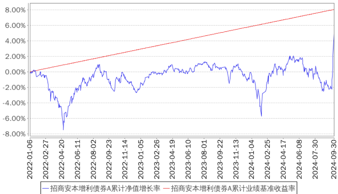
招商安本增利债券A累计净值增长率与同期业绩比较基准收益率的历史走势对比图