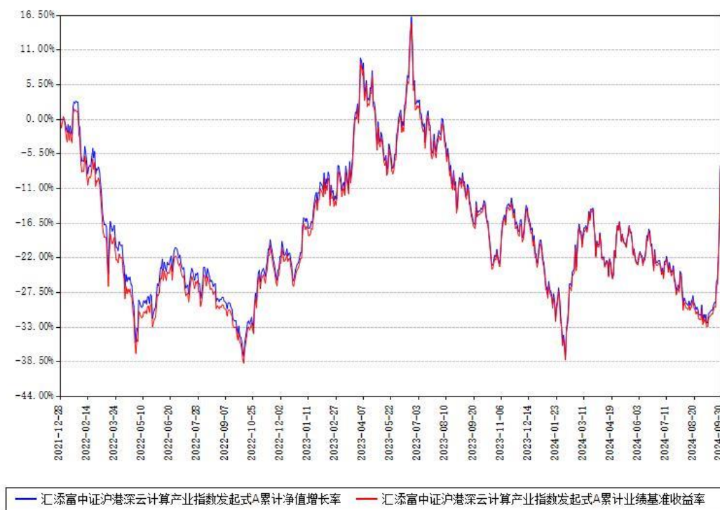
汇添富中证沪港深云计算产业指数发起式A累计净值增长率与同期业绩基准收益率对比图