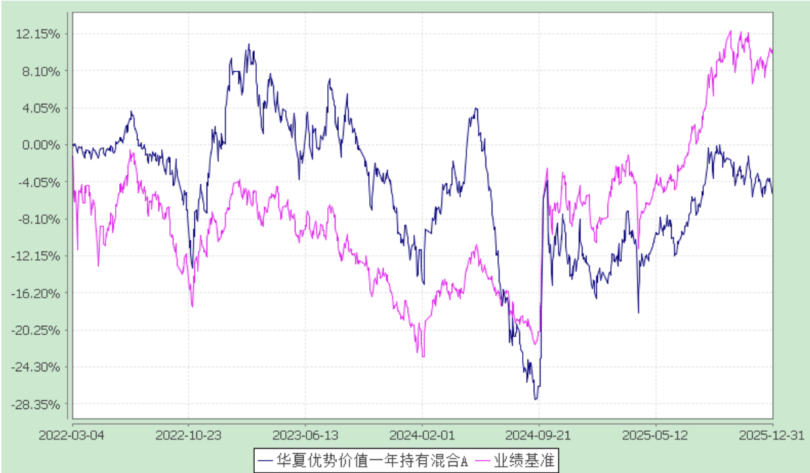
华夏优势价值一年持有混合 C: