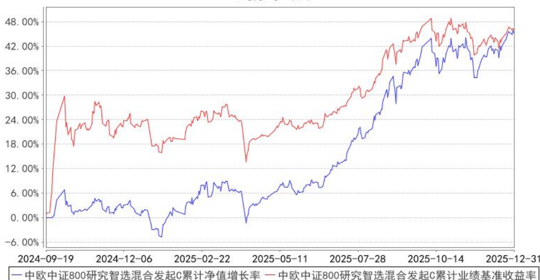
中欧中证800研究智选混合发起C累计净值增长率与同期业绩比较基准收益率的历史走势对比图

注：本基金基金合同生效日期为 2024 年 9 月 19 日，按基金合同的规定，本基金自基金合同生效起六个月为建仓期，建仓期结束时各项资产配置比例已经符合基金合同约定。