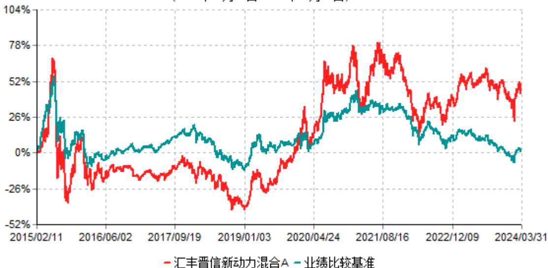
汇丰晋信新动力混合A累计净值增长率与业绩比较基准收益率历史走势对比图 (2015年02月11日-2024年03月31日)

注：1. 按照基金合同的约定，本基金的投资组合比例为：股票资产占基金资产的 50%-95%，其中投资于新动力主题的股票比例不低于非现金基金资产的 80%，权证投资占基金资产的 0-3%；现金、债券资产及中国证监会允许基金投资的其他证券品种占基金资产比例不低于 5%，现金（不包括结算备付金、存出保证金、应收申购款等）或者到期日在一年以内的政府债券不低于基金资产净值 5%。本基金自基金合同生效日起不超过六个月内完成