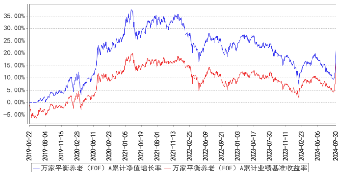
万家平衡养老（FOF）A 累计净值增长率与同期业绩比较基准收益率的历史走势对比图