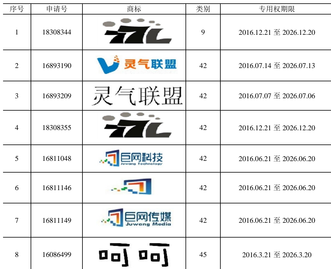
商标基本信息统计表

2. 巨网科技及其下属公司账面未记录的其他无形资产包括 8 项商标专用权、9 项域名、17 项计算机软件著作权。详见下表: