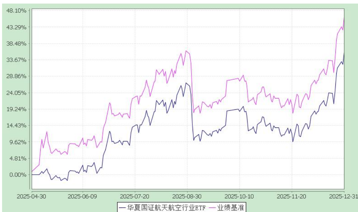
华夏国证航天航空行业交易型开放式指数证券投资基金 份额累计净值增长率与业绩比较基准收益率历史走势对比图 (2025 年 4 月 30 日至 2025 年 12 月 31 日)