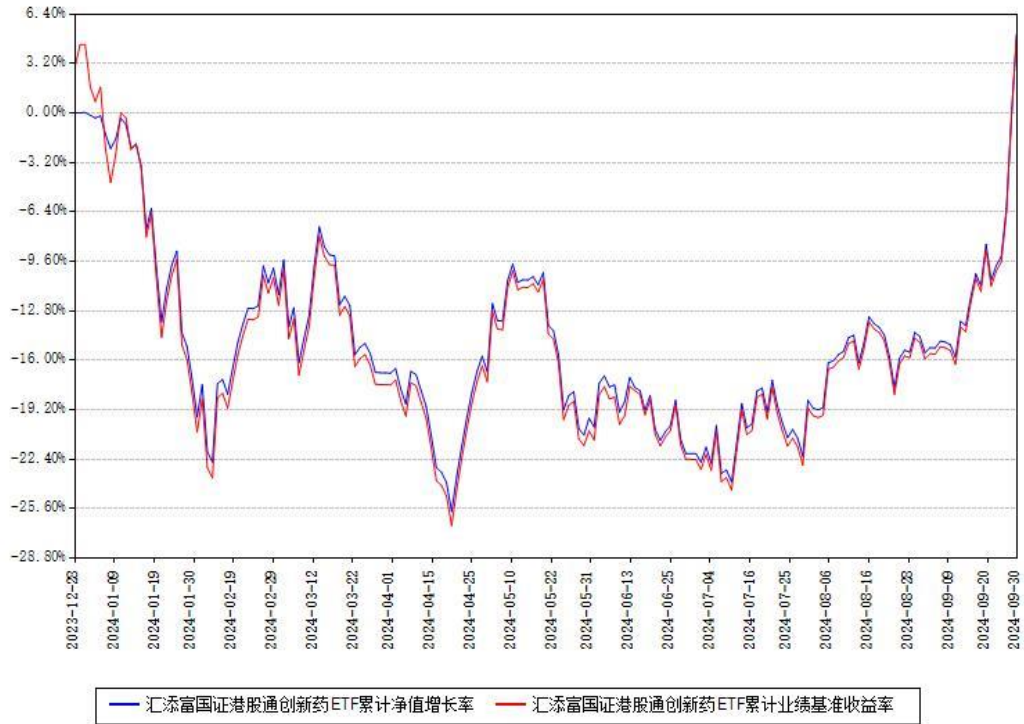
汇添富国证港股通创新药ETF累计净值增长率与同期业绩基准收益率对比图