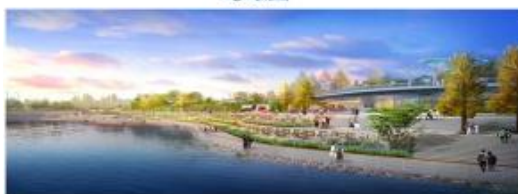
巴州区津桥湖城市基础设施和生态恢复建设项目 滨河休闲广场效果图