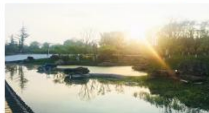
修文县小箐乡崇恩森林公园建设项目