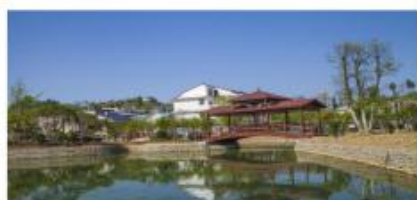
贵州安顺旧州镇把土村 人居环境改造项目