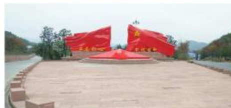
遵义苟坝红色文化旅游创新区建设项目