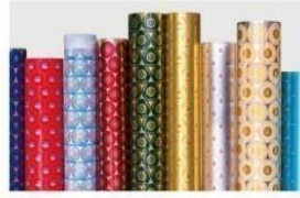
复合型防伪印刷铝板