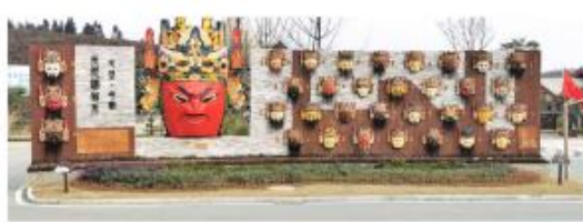
贵州安顺 邢江河国家级湿地公园项目