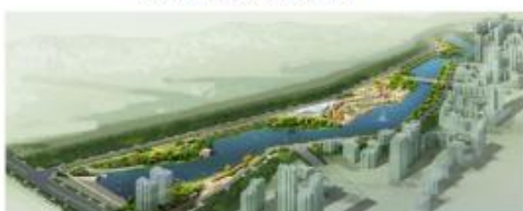
巴州区津桥湖城市基础设施和生态恢复建设项目 鸟瞰图