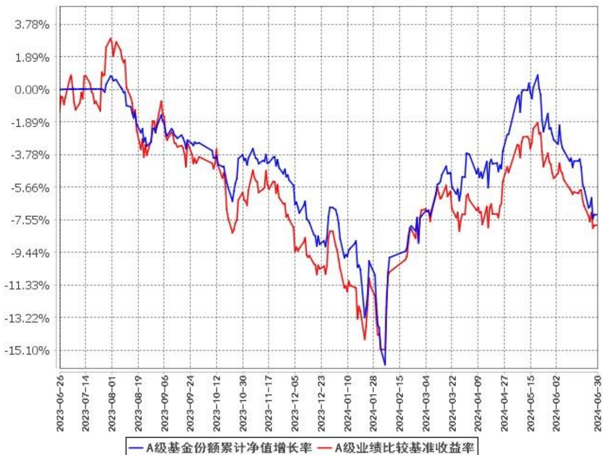
A级基金份额累计净值增长率与同期业绩比较基准收益率的历史走势对比图 (2023年6月26日至2024年6月30日)