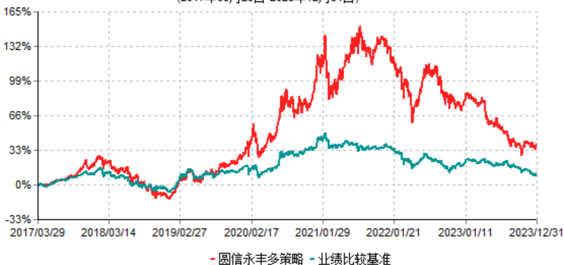
圆信永丰多策略精选混合型证券投资基金累计净值增长率与业绩比较基准收益率历史走势对比图 (2017年03月29日-2023年12月31日)