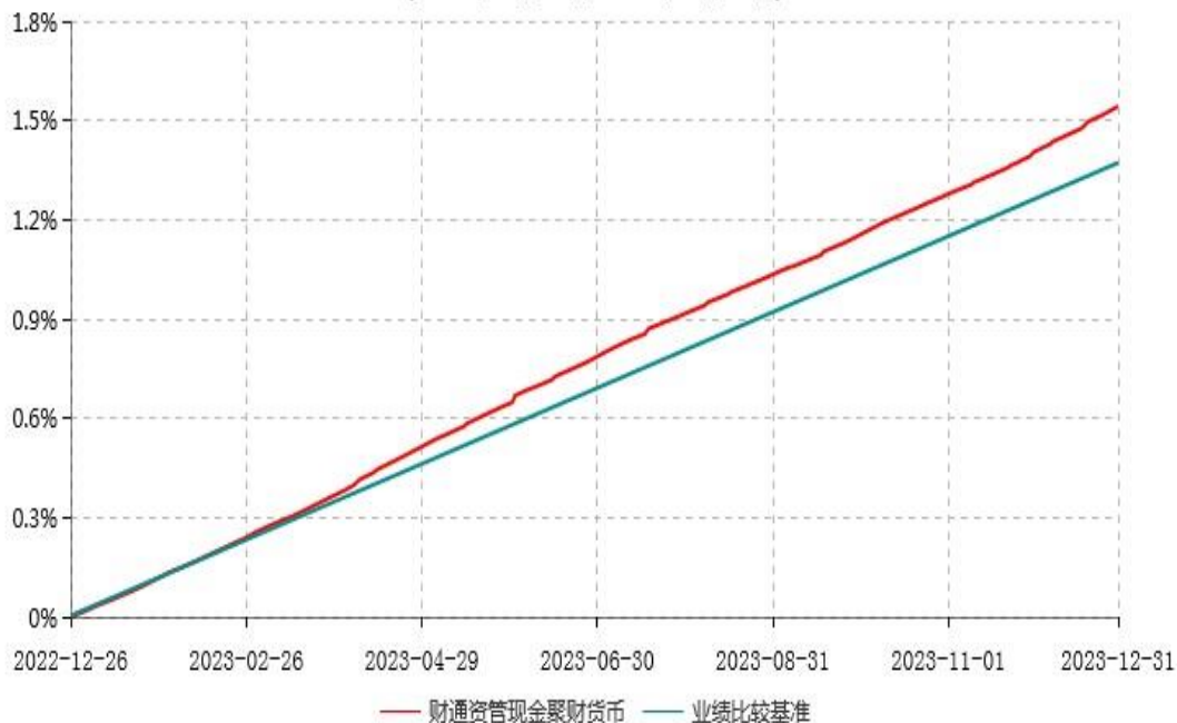
财通资管现金聚财货币市场基金累计净值收益率与业绩比较基准收益率历史走势对比图 (2022年12月26日-2023年12月31日)

注：本基金建仓期为自基金合同生效日起6个月，报告期末本基金已建仓完毕。截至建仓期结束，各项资产配置比例符合本基金基金合同约定。