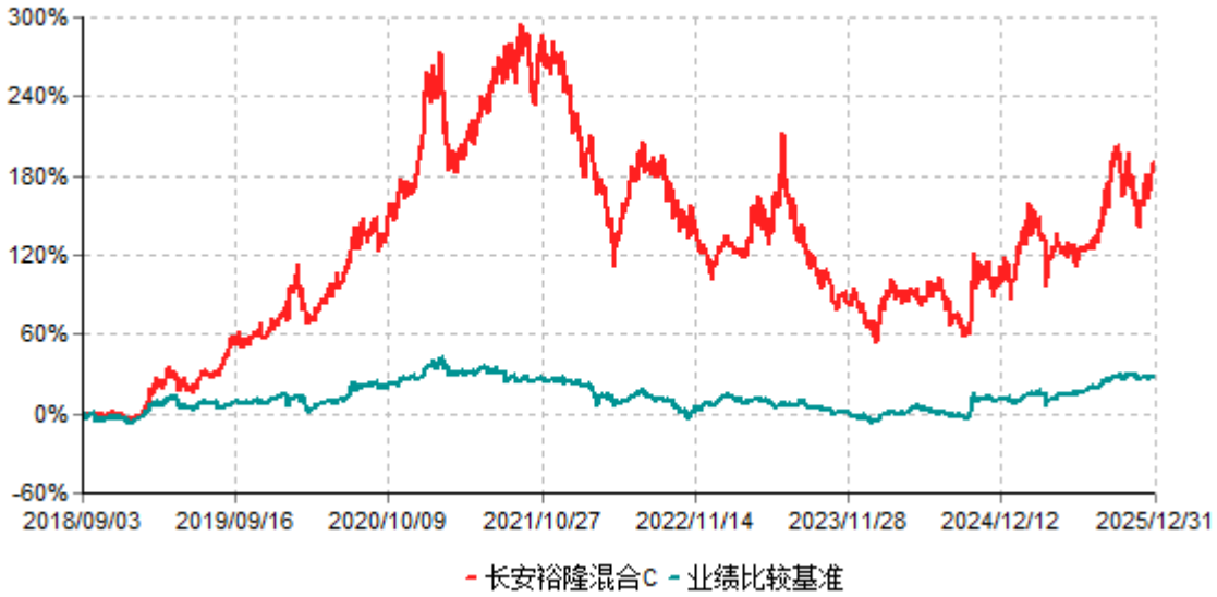
长安裕隆混合C累计净值增长率与业绩比较基准收益率历史走势对比图 (2018年09月03日-2025年12月31日)

根据基金合同的规定,自基金合同生效之日起6个月内基金各项资产配置比例需符合基金合同要求。本基金在建仓期结束后,各项资产配置比例已符合基金合同有关投资比例的约定。基金合同生效日至报告期末,本基金运作时间已满一年。图示日期为2018年09月03日至2025年12月31日。