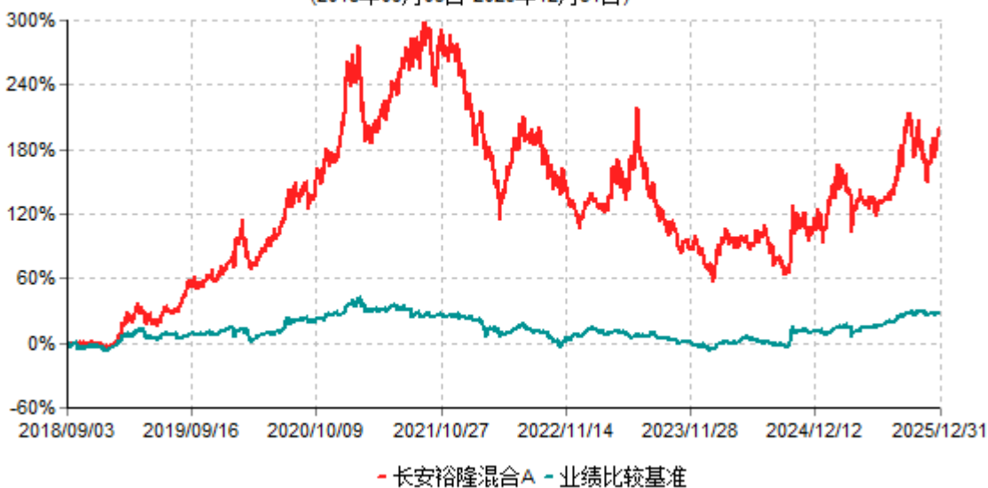
长安裕隆混合A累计净值增长率与业绩比较基准收益率历史走势对比图 (2018年09月03日-2025年12月31日)

根据基金合同的规定,自基金合同生效之日起6个月内基金各项资产配置比例需符合基金合同要求。本基金在建仓期结束后,各项资产配置比例已符合基金合同有关投资比例的约定。基金合同生效日至报告期末,本基金运作时间已满一年。图示日期为2018年09月03日至2025年12月31日。