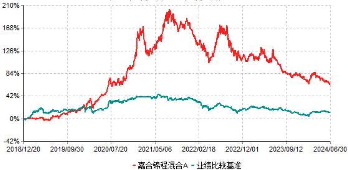
嘉合锦程混合A累计净值增长率与业绩比较基准收益率历史走势对比图 (2018年12月20日-2024年06月30日)