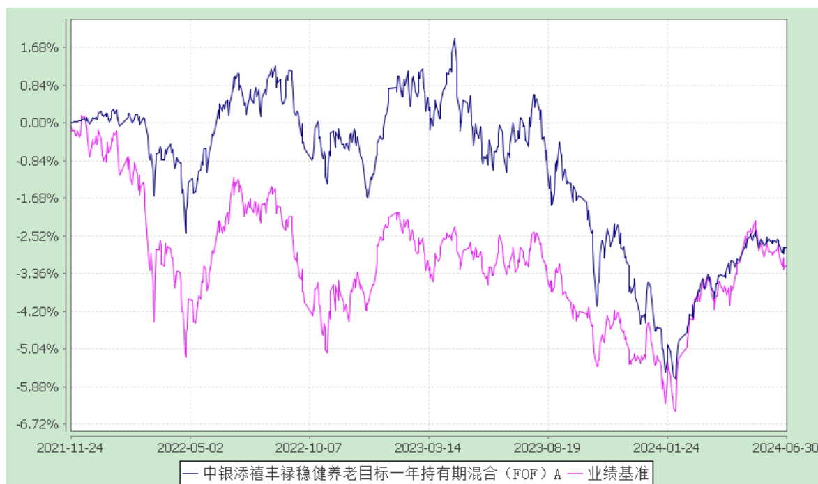
2. 中银添禧丰禄稳健养老目标一年持有期混合（FOF）Y: