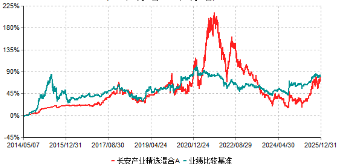
长安产业精选混合A累计净值增长率与业绩比较基准收益率历史走势对比图 (2014年05月07日-2025年12月31日)

长安产业精选混合A生效日为2014年05月07日，按基金合同规定，本基金自基金合同生效起6个月为建仓期，截止到建仓期结束时，本基金的各项投资组合比例已符合基金合