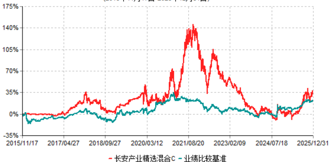
长安产业精选混合C累计净值增长率与业绩比较基准收益率历史走势对比图 (2015年11月17日-2025年12月31日)

长安产业精选混合C于2015年11月16日公告新增，实际首笔C类份额申购申请于2015年11月17日确认，图示日期为2015年11月17日至2025年12月31日。