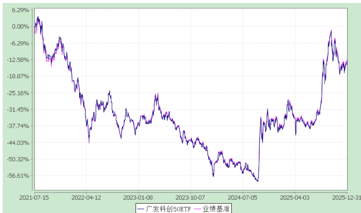
广发上证科创板 50 成份交易型开放式指数证券投资基金 份额累计净值增长率与业绩比较基准收益率的历史走势对比图 (2021 年 7 月 15 日至 2025 年 12 月 31 日)