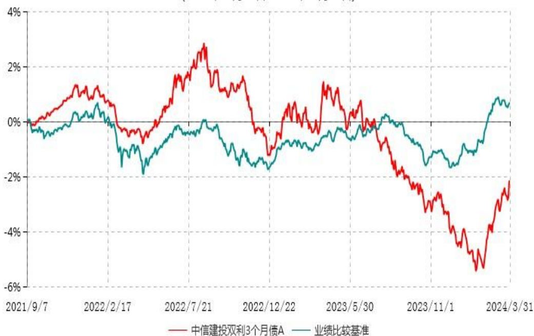
中信建投双利3个月债A累计净值增长率与业绩比较基准收益率历史走势对比图 (2021年09月07日-2024年03月31日)