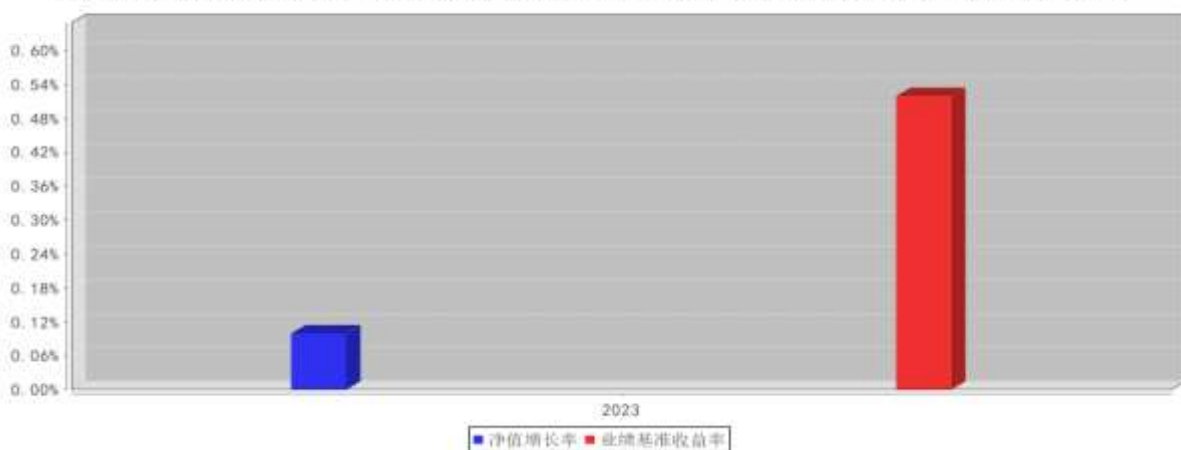
大成景泰纯债债券D基金每年净值增长率与同期业绩比较基准收益率的对比图 (2023年12月31日)

注: 1、基金的过往业绩不代表未来表现。 2、如合同生效当年不满完整自然年度的,按实际期限计算净值增长率。