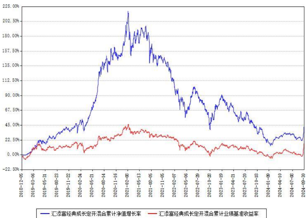
汇添富经典成长定开混合累计净值增长率与同期业绩基准收益率对比图