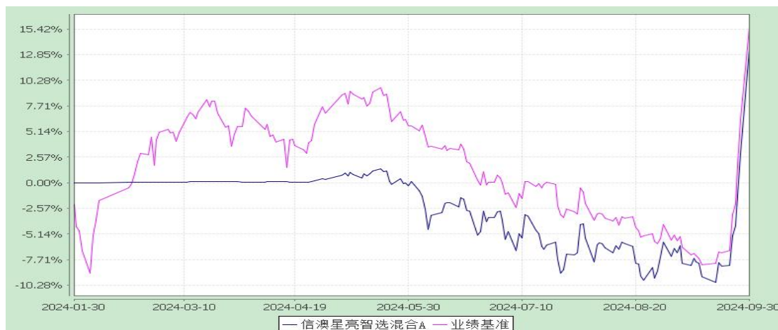
信澳星亮智选混合 C 累计净值增长率与业绩比较基准收益率的历史走势对比图