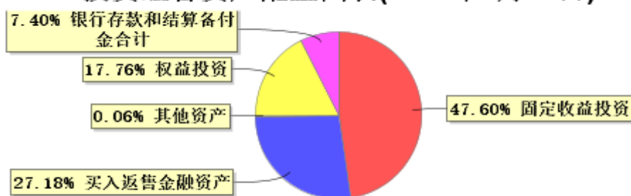
投资组合资产配置图表(2024年6月30日)