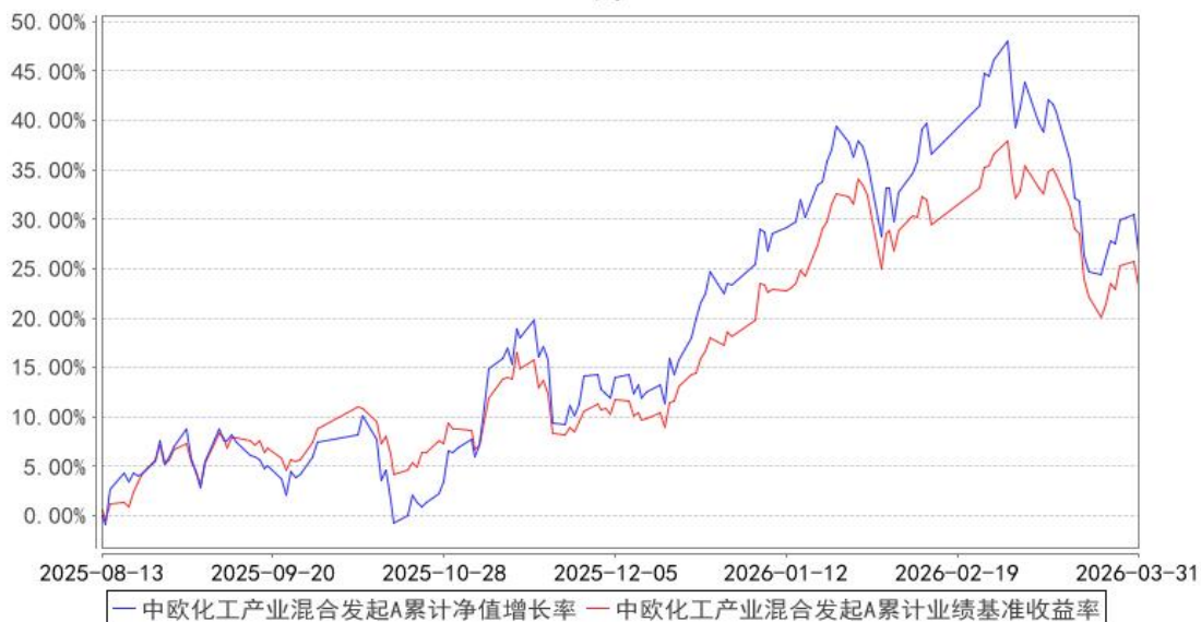
中欧化工产业混合发起A累计净值增长率与同期业绩比较基准收益率的历史走势对比图

注：本基金基金合同生效日期为 2025 年 8 月 13 日，自基金合同生效日起到本报告期末不满一年，按基金合同的规定，本基金自基金合同生效起六个月为建仓期，建仓期结束时各项资产配置比例已经符合基金合同约定。