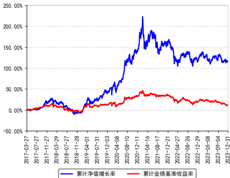
南方智慧精选灵活配置混合累计净值增长率与同期业绩比较基准收益率的历史走势对比图