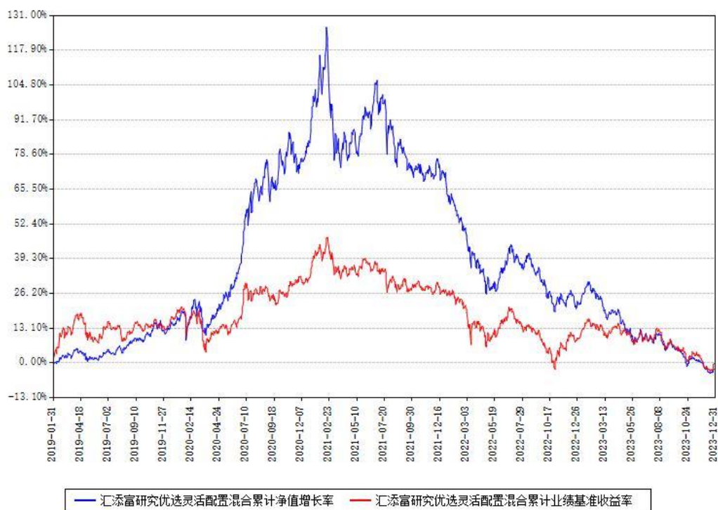
汇添富研究优选灵活配置混合累计净值增长率与同期业绩基准收益率对比图

注：本基金建仓期为本《基金合同》生效之日（2019年01月31日）起6个月，建仓期结束时各项资产配置比例符合合同约定。