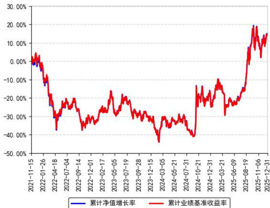
南方中证物联网主题ETF累计净值增长率与同期业绩比较基准收益率的历史走势对比图