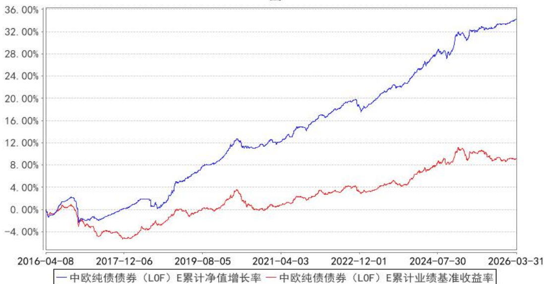
中欧纯债债券（LOF）E 累计净值增长率与同期业绩比较基准收益率的历史走势对比图

注：自 2016 年 4 月 6 日起，本基金新增 E 类份额，图示日期为 2016 年 4 月 8 日至 2026 年 03 月 31 日。