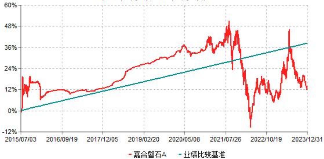
嘉合磐石A累计净值增长率与业绩比较基准收益率历史走势对比图 (2015年07月03日-2023年12月31日)