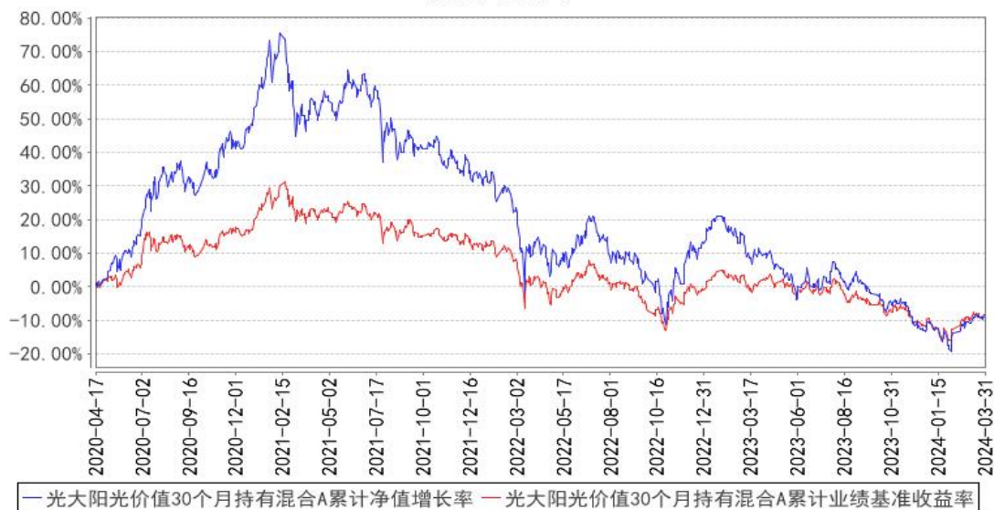
光大阳光价值 30 个月持有混合 A 累计净值增长率与同期业绩比较基准收益率的历史走势对比图