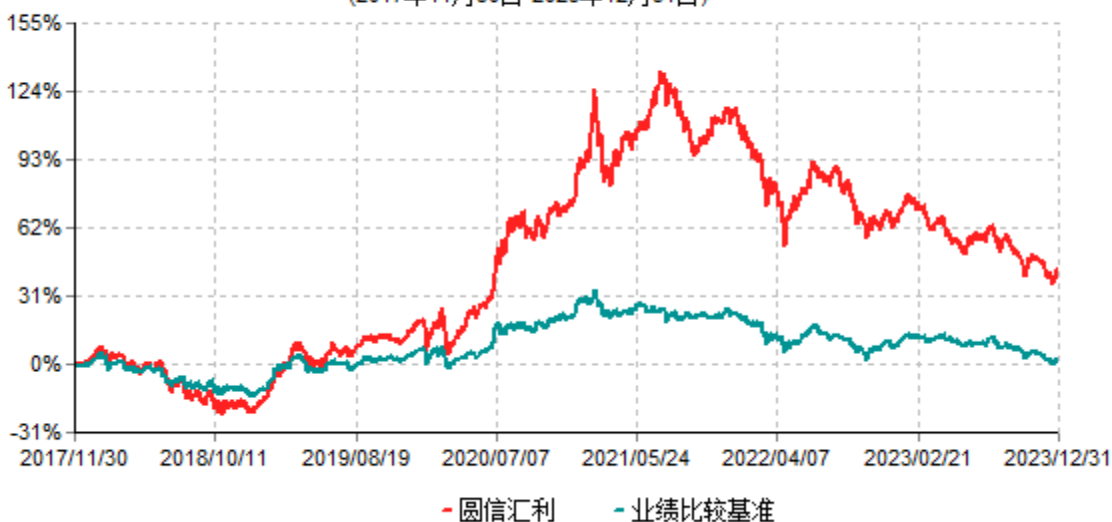
圆信永丰汇利混合型证券投资基金（LOF）累计净值增长率与业绩比较基准收益率历史走势对比图 (2017年11月30日-2023年12月31日)