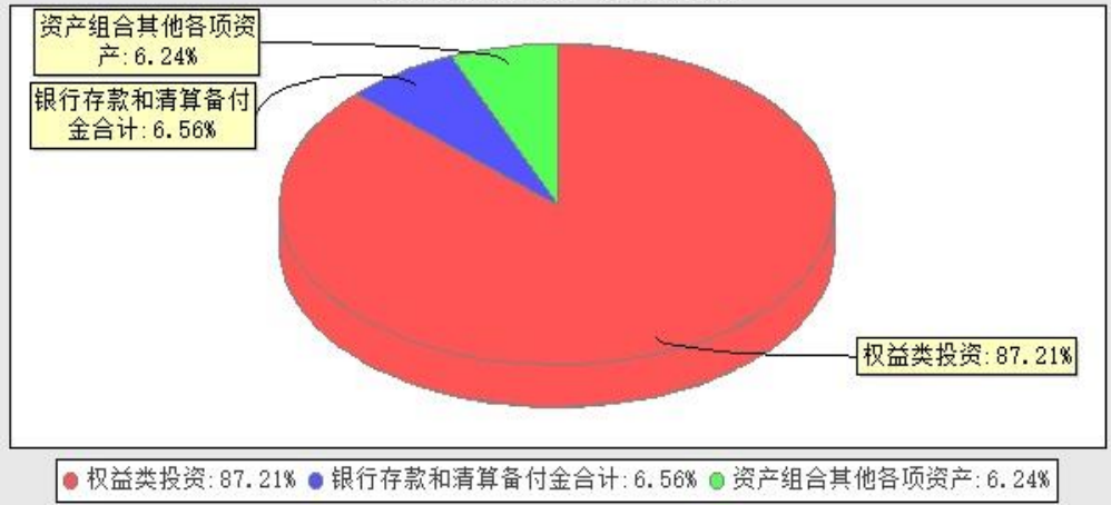
华宝海外新能源汽车股票型发起式证券投资基金(QDII)投资组合资产配置图表 (数据截止日期: 20240930)