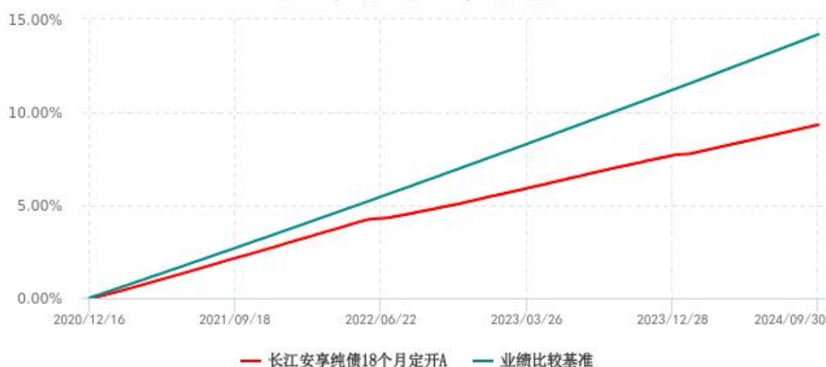
长江安享纯债18个月定开A累计净值增长率与业绩比较基准收益率历史走势对比图 (2020年12月16日-2024年9月30日)