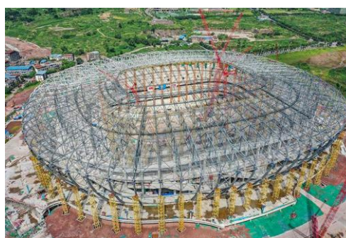
图8：NCC钢结构应用于体育场馆