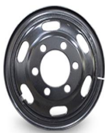
图1：型钢钢轮（适用于特殊路况重载车型）