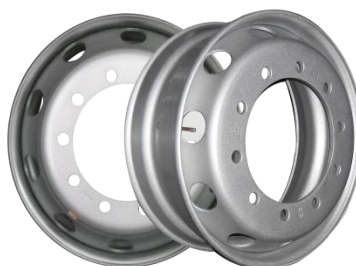
图2：轻量化无内胎钢轮（适用于轻量化商用车型）