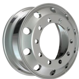
图3：锻造铝合金轮毂（适用于高端商用车型、新能源车型、特种车辆）