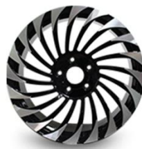
图4：轿车锻造铝轮（新开发产品，应用于改装车）