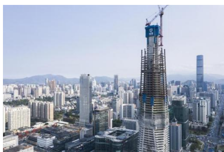
图7：NCC钢结构应用于超高层建筑