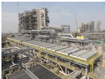
图5：NCC石化钢结构应用于炼油领域