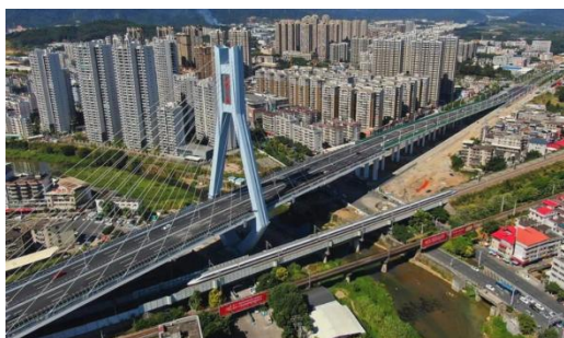
图6：NCC桥梁钢结构应用于跨线桥