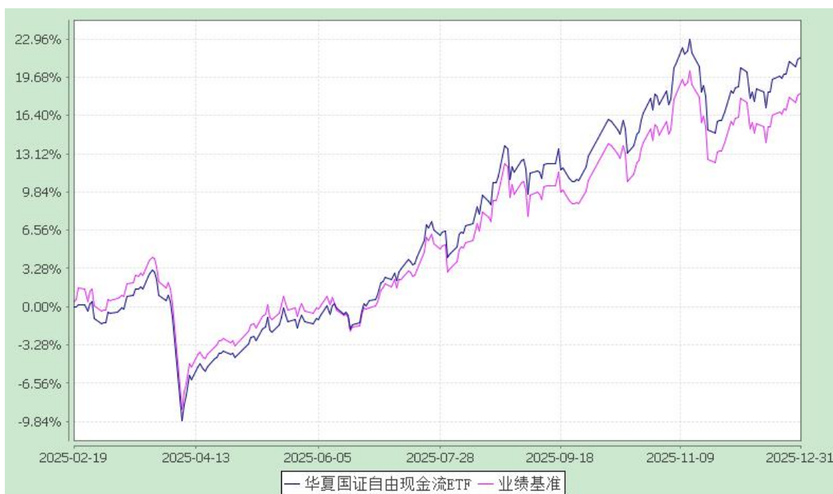
华夏国证自由现金流交易型开放式指数证券投资基金 份额累计净值增长率与业绩比较基准收益率历史走势对比图 (2025年2月19日至2025年12月31日)