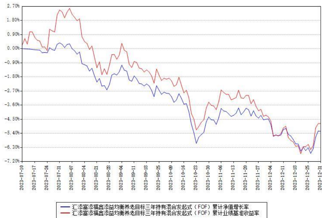
汇添富添福鑫添益均衡养老目标三年持有混合发起式（FOF）累计净值增长率与同期业绩基准收益率对比图

注：本《基金合同》生效之日为 2023 年 07 月 10 日，截至本报告期末，基金成立未满一年。本基金建仓期为本《基金合同》生效之日起 6 个月，截至本报告期末，本基金尚处于建仓期中。