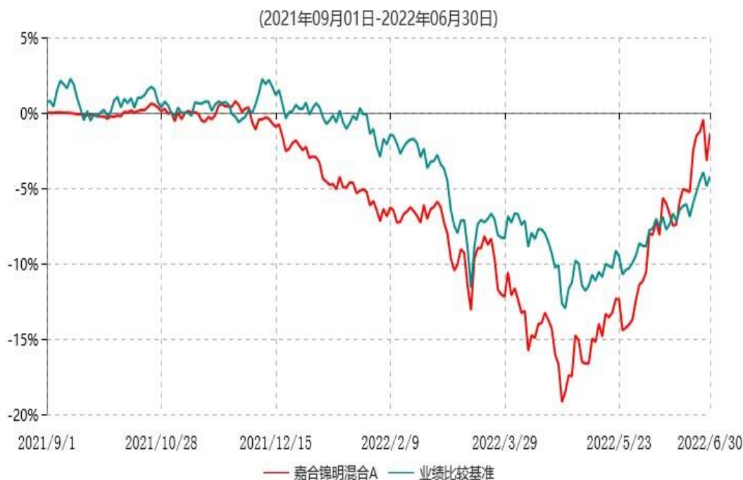
嘉合锦明混合A累计净值增长率与业绩比较基准收益率历史走势对比图

注：1、本基金基金合同于 2021 年 09 月 01 日生效。截至本报告期末，本基金基金合同生效不满一年。