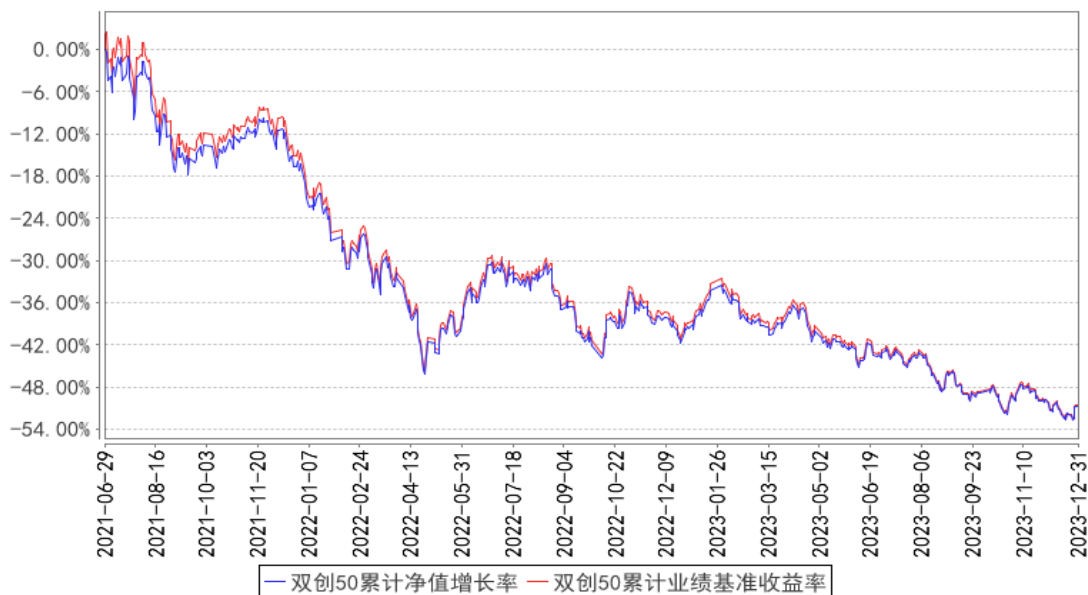
双创50累计净值增长率与同期业绩比较基准收益率的历史走势对比图

注：按基金合同规定，本基金自基金合同生效起六个月为建仓期，建仓期结束时本基金的各项资产配置比例已达到基金合同的规定：本基金投资于标的指数成份股及备选成份股的资产比例不低于基金资产净值的90%，且不低于非现金基金资产的80%，每个交易日日终在扣除股指期货合约、股票期权合约需缴纳的交易保证金后，应当保持不低于交易保证金一倍的现金，其中，现金不包括结算备付金、存出保证金和应收申购款等，因法律法规的规定而受限制的情形除外。