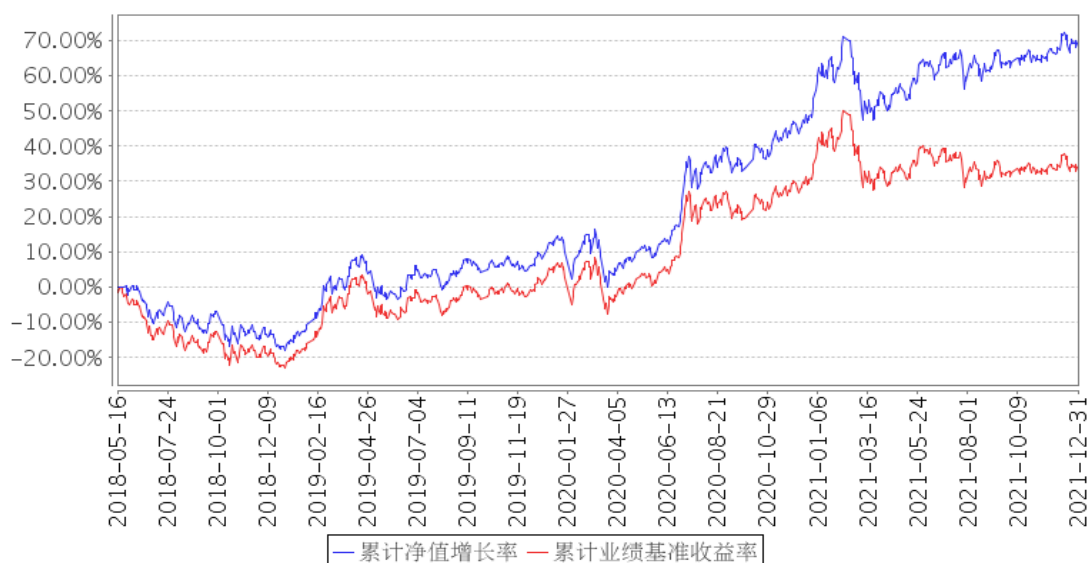
景顺长城MSCI中国A股国际通ETF联接累计净值增长率与同期业绩比较基准收益率的历史走势对比图

注：基金的投资组合比例为：本基金投资于目标 ETF 的比例不低于基金资产净值的 90%，本基金保持不低于基金资产净值 5% 的现金或到期日在一年以内的政府债券，其中现金不包括结算备付金、存出保证金和应收申购款等。本基金的建仓期为自 2018 年 5 月 16 日基金合同生效日起 6 个月。建仓期结束时，本基金投资组合达到上述投资组合比例的要求。