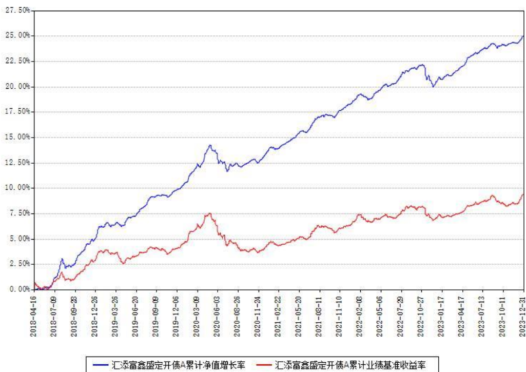
汇添富鑫盛定开债A累计净值增长率与同期业绩基准收益率对比图

注：本基金建仓期为本《基金合同》生效之日（2018年04月16日）起6个月，建仓期结束时各项资产配置比例符合合同约定。