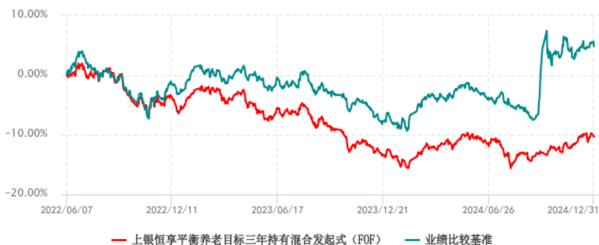
上银恒享平衡养老目标三年持有期混合型发起式基金中基金（FOF）累计净值增长率 与业绩比较基准收益率历史走势对比图 (2022年06月07日-2024年12月31日)

注：本基金合同生效日为 2022 年 06 月 07 日，自基金合同生效日起 6 个月内为建仓期，建仓期结束时各项资产配置比例符合基金合同约定。