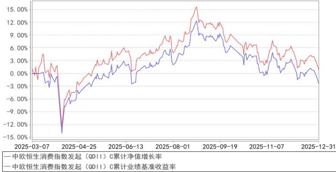
中欧恒生消费指数发起（QDII）C累计净值增长率与同期业绩比较基准收益率的历史走势对比图

注：本基金基金合同生效日期为 2025 年 3 月 7 日，自基金合同生效日起到本报告期末不满一年，按基金合同的规定，本基金自基金合同生效起六个月为建仓期，建仓期结束时各项资产配置比例已经符合基金合同约定。