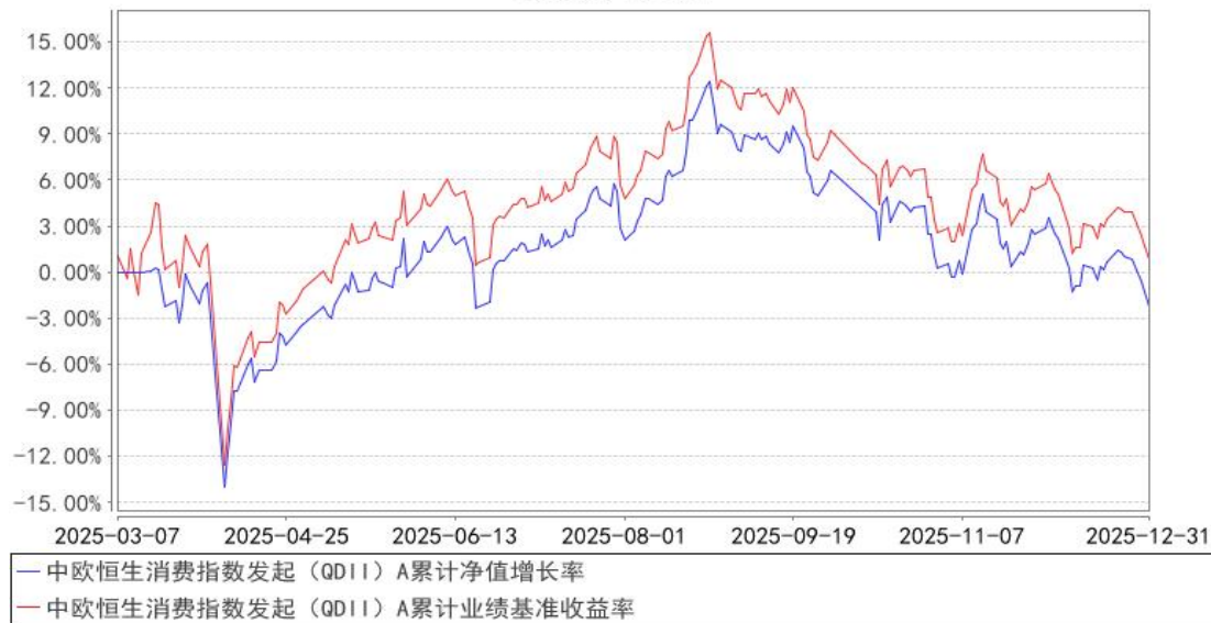
中欧恒生消费指数发起（QDII）A 累计净值增长率与同期业绩比较基准收益率的历史走势对比图

注：本基金基金合同生效日期为 2025 年 3 月 7 日，自基金合同生效日起到本报告期末不满一年，