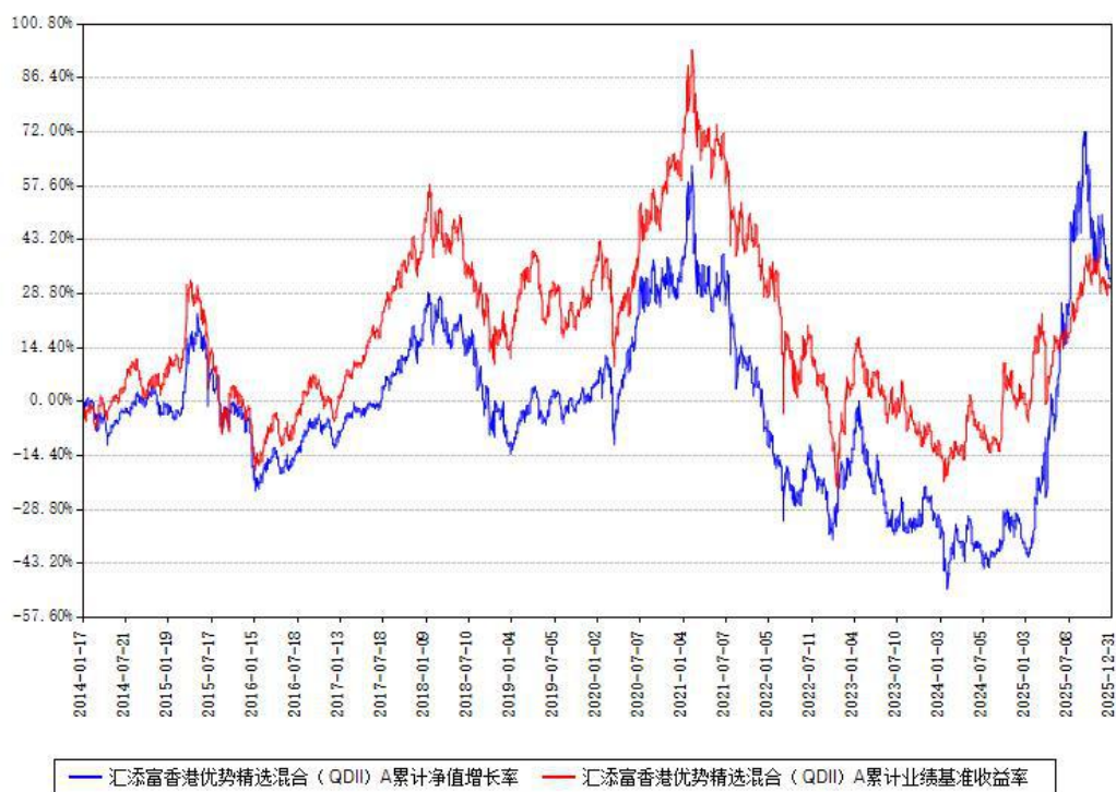
汇添富香港优势精选混合（QDII）A累计净值增长率与同期业绩基准收益率对比图