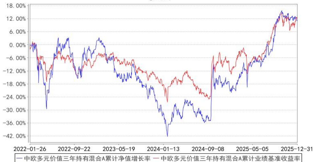
中欧多元价值三年持有混合A累计净值增长率与同期业绩比较基准收益率的历史走势对比图