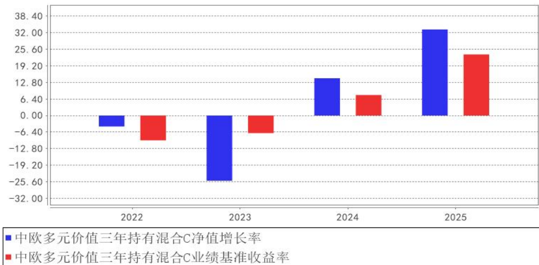
中欧多元价值三年持有混合C基金每年净值增长率与同期业绩比较基准收益率的对比图

注：本基金合同生效日为 2022 年 1 月 26 日，2022 年度数据为 2022 年 1 月 26 日至 2022 年 12 月 31 日数据。